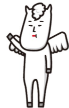
Hakuba village character VICTOIRE CHEVAL BLANC MURAO III

We will use the SWAT Mobility Japan system.